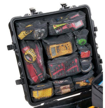
0379 Organizador de tapa