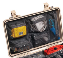
1519 Organizador de tapa