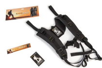
RucPac-normal Conversión de mochila RucPac estándar Hardcase