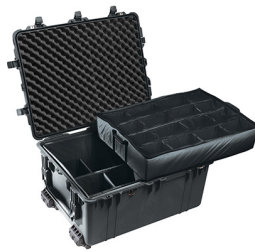
1634 With Padded Dividers