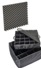
1635 Divisores acolchados