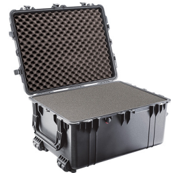
1630WF With Foam