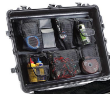
1639 Organizador de tapa