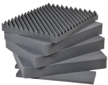
1631 Juego de 5 piezas de espuma de recambio