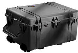
1630NF No Foam