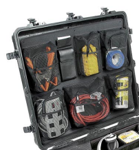
1699 Organizador de tapa