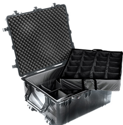
1694 With Padded Dividers