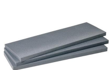
1721 Juego de 3 piezas de espuma de recambio