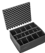
1615 Divisores acolchados