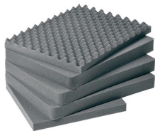
1611 Juego de 5 piezas de espuma de recambio