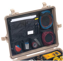
1609 Organizador de tapa