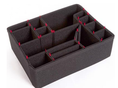
1610EUTP Kit de divisores TrekPak