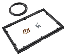
1150PF Panel de adaptación para aplicación especial