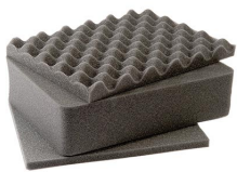
1401 Juego de 3 piezas de espuma de recambio