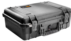
1500NF No Foam