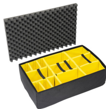
1655 Divisores acolchados