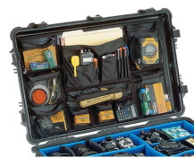
1659 Organizador de material fotográfico/tapa