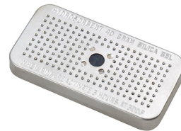
1500D El gel de sílice desecante Peli