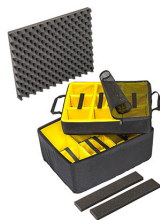
1607AirDS Cloison en mousse