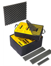
1637AirDS Cloison en mousse