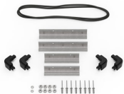
iM20XX-M4-BEZEL Lunette de base (métrique)