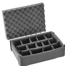
iM2200-DIV Cloison en mousse