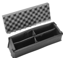
iM2306-DIV Cloison en mousse