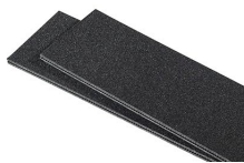
IM2720TPDIV Séparateurs TrekPak supplémentaires

c/ Provença, 388, Planta 7 • Barcelona, Spain 08025 • Phone: +34 934 674 999 info@peli.com • www.peli.com