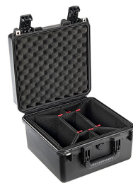
iM2275-X0006 With TrekPak Divider System