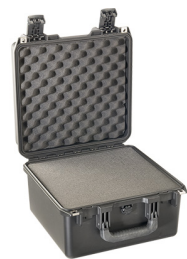
iM2275-X0001 With Foam