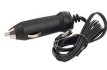
8056F Prise de 12 V pour chargeur rapide