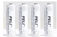
2469P Pile de rechange