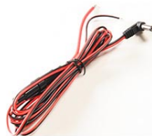
6061F Kit de câblage direct pour chargeur rapide