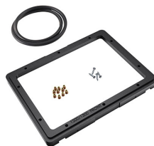
1200PF Cadre de panneau pour application spéciale