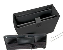
1436 Trousse de séparateurs bureau