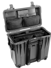
1447 With Padded Office Set & Lid Organizer