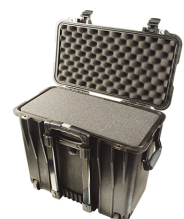
1440WF With Foam