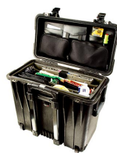
1446 Cloisons en mousse et Pochette couvercle Office