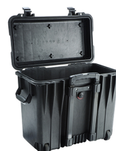
1440NF No Foam