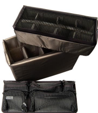
1445 Cloisons en mousse et Pochette couvercle Utility