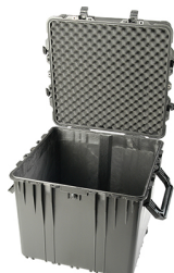
0370NF No Foam