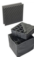
0375 Cloison en mousse