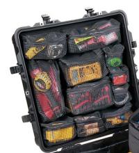
0379 Pochette couvercle