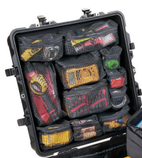
0379 Pochette couvercle