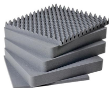
1641 Jeu de mousses de rechange, 5 pièces