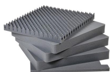
1691 Jeu de mousses de rechange, 5 pièces