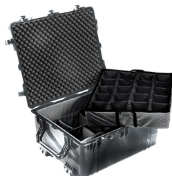
1694 With Padded Dividers