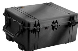
1690NF No Foam