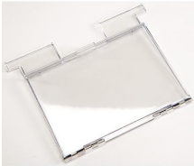
1630DC Accessoire conteneur de documents