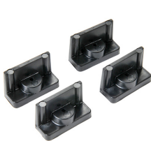
1507QM Supports rapides - jeu de 4