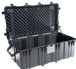
0550NF No Foam