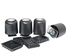
0508 Kit élévateur de palettes