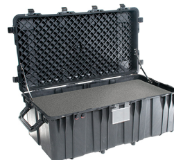
0550WF With Foam