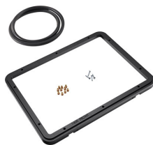
1400PF Cadre de panneau pour application spéciale