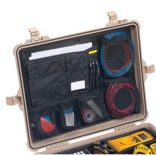
1609 Pochette couvercle