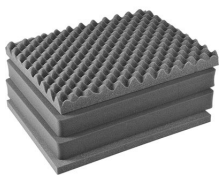
1601 Jeu de mousses de rechange, 4 pièces