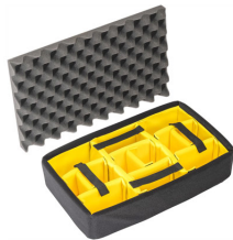
1485AirDS Cloison en mousse