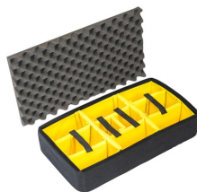
1555AirDS Cloison en mousse