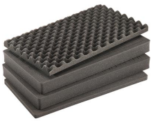
1555AirFS Jeu de mousses de rechange, 4 pièces