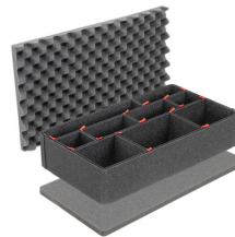
1555TPKIT Kit de séparation de la valise TrekPak