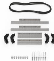
iM2200-M4-BEZEL-L Cadre de couvercle (métrique)