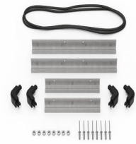
iM2200-MBEZ-B Cadre de base (métrique)