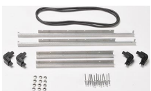
iM27XX-M4-BEZEL-L Cadre de couvercle (métrique)