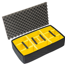
1605AirDS Set di divisori imbottiti