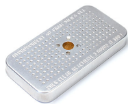
1500D Gel di silice essiccante