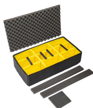
1615AirDS Set di divisori imbottiti