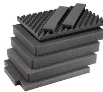
1607AirFS 7 pz. set ricambio schiuma