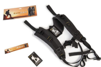
RucPac-normal Conversione zaino RucPac standard Hardcase