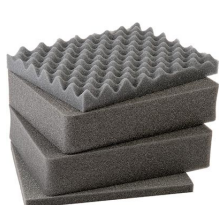
1301 4 pz. set ricambio schiuma