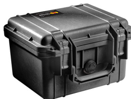
1300NF No Foam