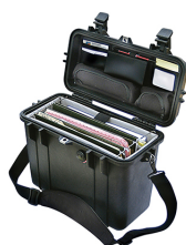
1437 With Padded Office Divider Set & Lid Organizer