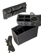
1435 Set di divisori imbottiti