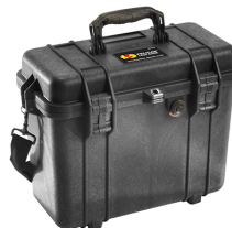
1430NF No Foam