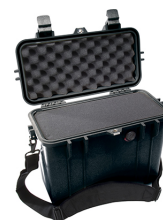
1430WF With Foam