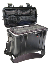
1434 With Padded Dividers & Lid Organizer