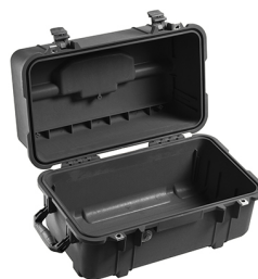
1460NF No Foam