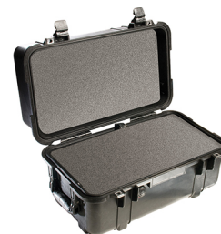
1460WF With Foam