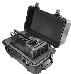
1460AALG With Custom Foam for 9430 / 9435