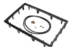
1490PF Telaio del pannello per applicazioni speciali