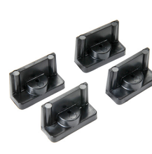
1507QM Supporti veloci - set di 4