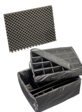
1695 Set di divisori imbottiti