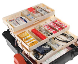
1466 Tray System for 1460EMS