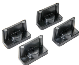
1507QM Supporti veloci - set di 4