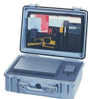
1509 Coperchio organizer