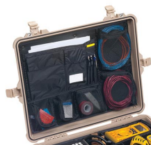
1609 Coperchio organizer