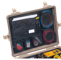
1609 Coperchio organizer