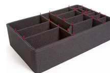
1650EUTP Kit divisorio per valigie TrekPak