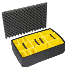
1655 Set di divisori imbottiti