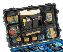
1659 Foto/coperchio organizer