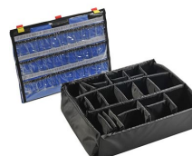
1555EMS EMS Accessory Set (Lid Organizer and Divider Set)