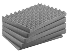
iM2600-FOAM Комплект запасных прокладок из вспененного материала (5 шт.)