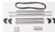
iM2600-M4-BEZEL-L Lid Bezel (Metric)