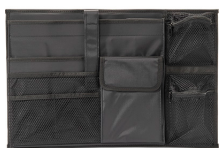
iM26XX-UTILITYORG Отделения для предметов общего назначения