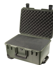
iM2620-X0001 With Foam