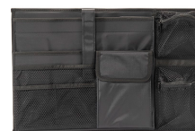
iM26XX-UTILITYORG Отделения для предметов общего назначения