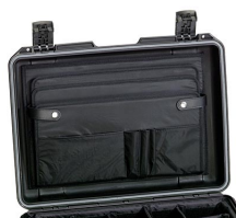
iM26XX-LIDORG Отделения на крышке