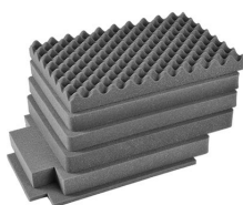
iM2620-FOAM Комплект запасных прокладок из вспененного материала (6 шт.)